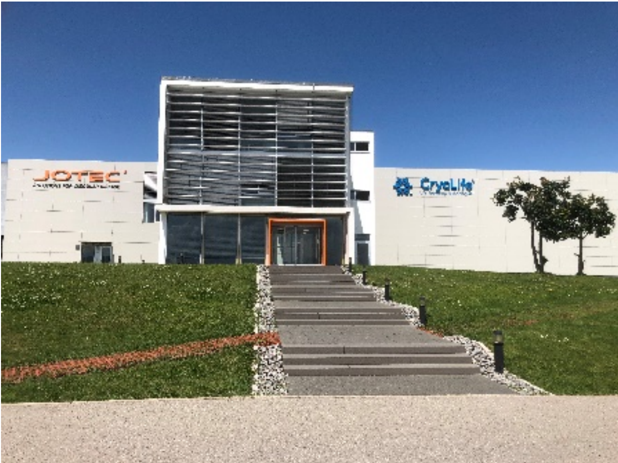
Eingangsbereich mit Verwaltungs- und Logistiktrakt der Firma JOTEC GmbH

Somit gilt die nunmehr als Global Player agierende Firma JOTEC GmbH als Beispiel für den erfolgreichen, standortsichernden Weg eines schwäbischen Unternehmens, Arbeitsplätze, sowie die Unternehmenskultur regional zu verankern und gleichzeitig ihre Produkte „Made in Germany“ auf dem global vernetzten Weltmarkt zu etablieren. Der Produktionsstandort Hechingen soll ausgebaut werden, um die erwartete zusätzliche Nachfrage aus den USA abdecken zu können.