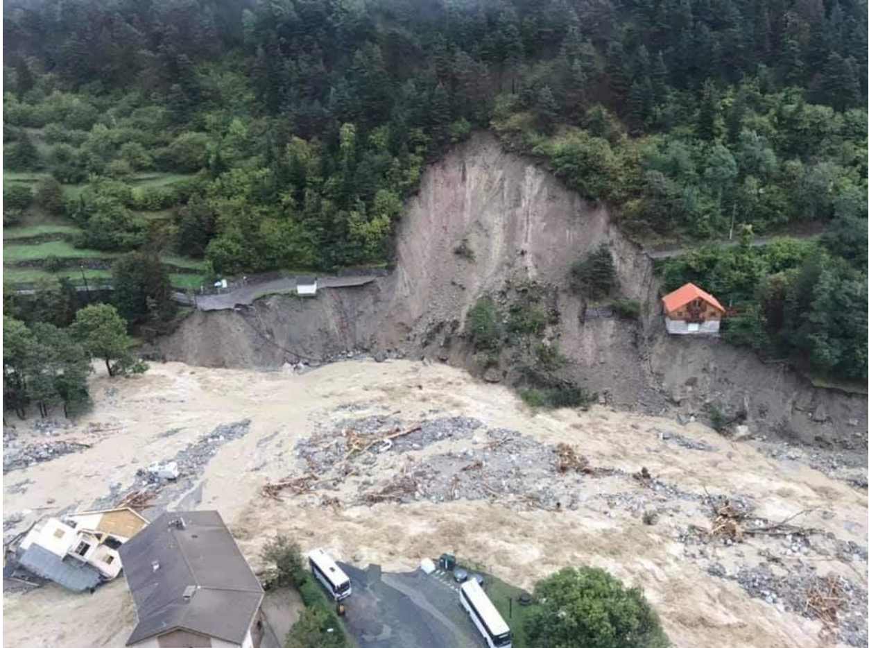
Zerstörungen und Erdrutsche nach dem Hochwasser der Vésubie, nachdem schwere Regenfälle die Region Alpes-Maritimes heimgesucht hatten - 03/10/2020 (Pompier06)

Eine Reihe von Dörfern erlitten schwere Schäden mit zerstörten Brücken, Strassenblockaden und abgeschnittenen Gemeinden rund um die Stadt Nizza. Der Bürgermeister von Nizza bezeichnete das Extremereignis als die schlimmsten Überschwemmungen seit Menschengedenken. In Norditalien wurden Straßen und Brücken vom Hochwasser weggespült, während mehrere Flüsse über die Ufer traten.